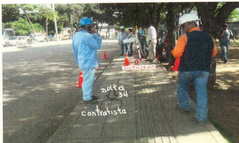
Delta 34 materializado por la UIS y delta No. 34 materializado por el contratista, no coinciden