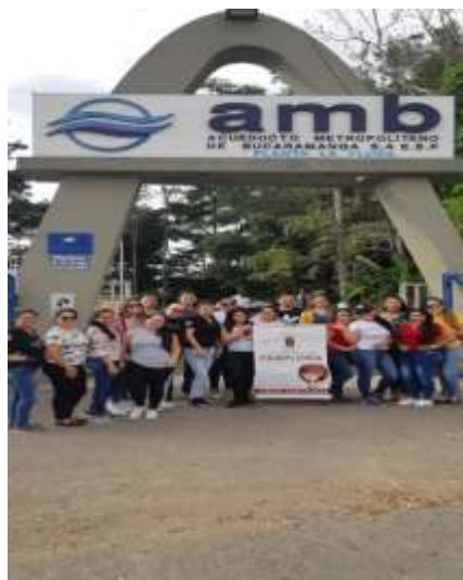
Visita planta de Tratamiento La Flora- Estudiantes Universidad de Pamplona

segundo trimestre de 2019, en el amb participó de actividades como el día del reciclaje, campaña post consumo de residuos peligrosos y Día del Medio Ambiente, ensúciate para limpiar el agua. De igual manera se continúa con la atención de visitas a las plantas de tratamiento y Acualago, espacios en donde se da a conocer la importancia del cuidado del agua y el proceso de potabilización.