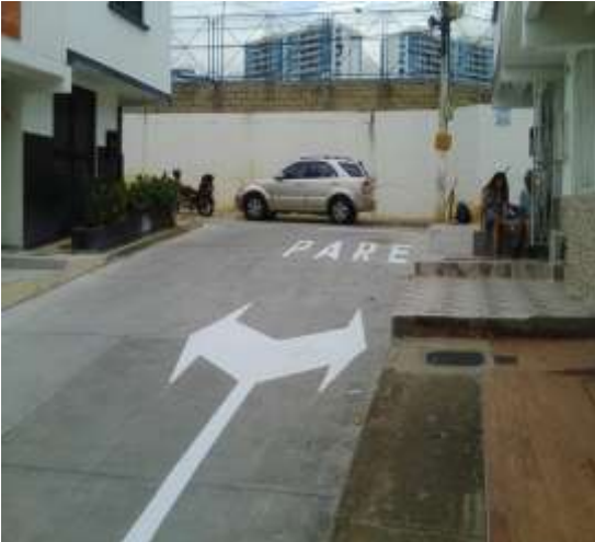
POIR 6.2 REPOSICIÓN BARRIO LA PEDREGOSA

del Vivero inició su ejecución a finales del mes de junio y la reposición de la conducción Florida-el Carmen, iniciará en el mes de julio; estas obras finalizan en el segundo semestre de la presente vigencia.