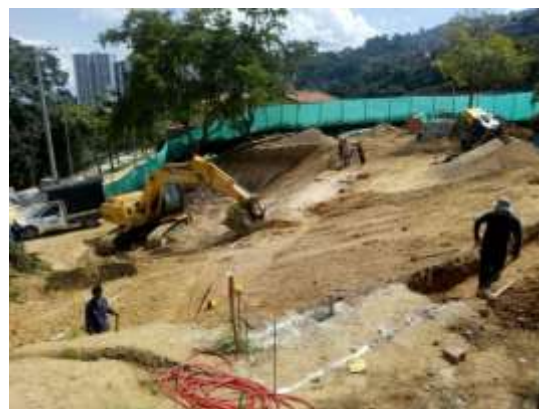
ADECUACIÓN TANQUE CABECERA

La inversión por concepto de estos 2 proyectos asciende a la suma de $2.021'801.307.