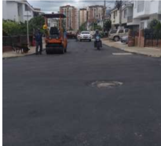
POIR 6.3 REPOSICIÓN BARRIO LOS PINOS