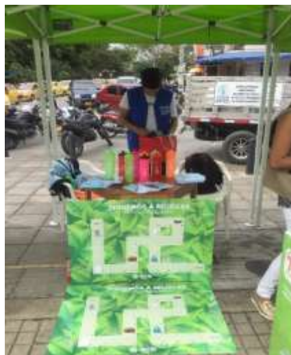
Participación Día del Reciclaje