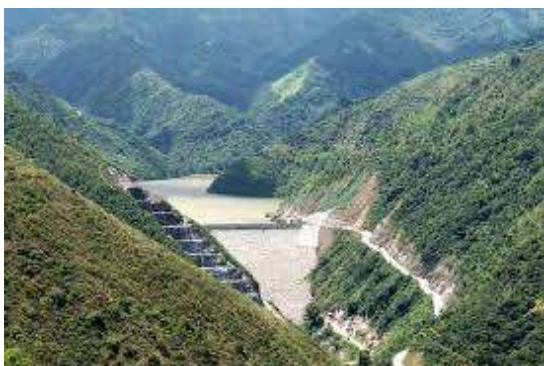
Panorámica del Embalse de Bucaramanga

A la fecha el amb S.A. E.S.P. realiza la operación y mantenimiento de las obras construidas.